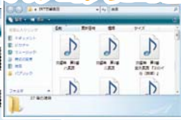
※画面はサンプルです