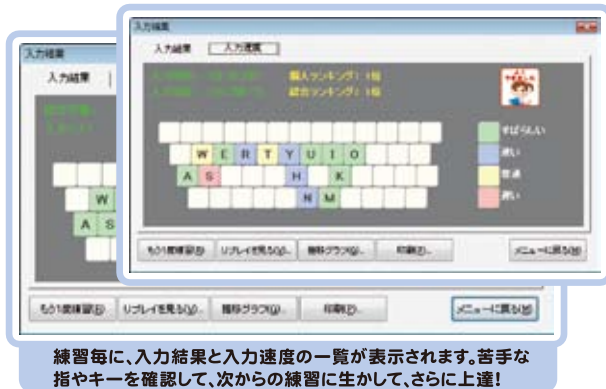
練習毎に、入力結果と入力速度の一覧が表示されます。苦手な指やキーを確認して、次からの練習に生かして、さらに上達!

複数のユーザーに対応! 複数のユーザーを登録して、個別に成績等を記録し、ランキングを表示することも可能です!